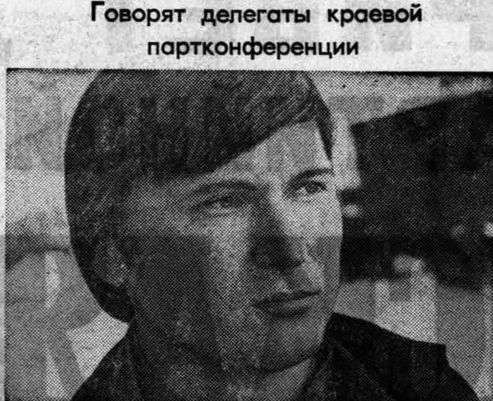
Говорят делегаты краевой партконференции

В СТРОЙ ДЕЙСТВУЮЩИХ РАЙОНОВ введена железная дорога Малиновое Озеро — Локоть. НА КАРТЕ КРАЯ 29 ноября 1979 года появился новый город — Заринск. Это главная стройплощадка Алтай, на которой сооружается мощный коксохимический завод, объявленный Всесоюзной ударной стройкой. В КАМУН НОВОГО ГОДА государственная комиссия пришла в эксплуатацию Гилевский гидроузел — головное сооружение Алейской оросительной системы. ПОЧТИ СТА КИЛОМЕТРОВ достигла протяженность Куудинского канала — директивной стройки 10-й пятилетки.