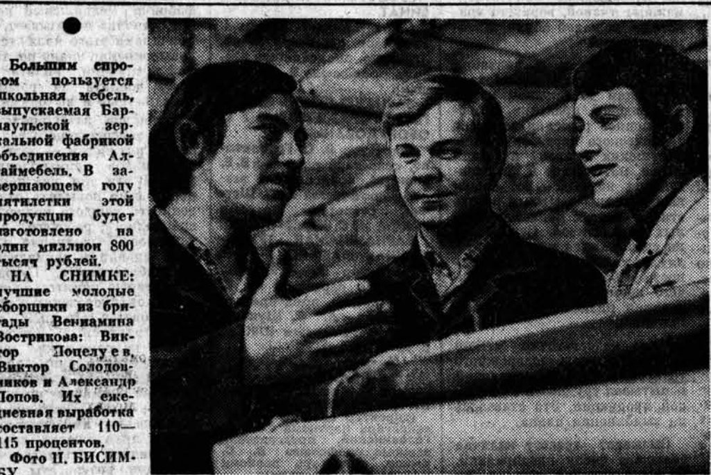
Большим спросом пользуется школьная мебель, выпускаемая Барнаульской заводской объединением Алтайского края. В завершающем году пятилетки этой продукции будет изготовлено на один миллион 800 тысяч рублей.

задача ставилась так, чтобы с планом справлялся каждый коллектив, а с заданием — каждый рабочий. При этом, чтобы выйти победителем соревнования, мало было добиться успеха в том или другом месяце. По новым условиям соревнования учитываются нарастающим итогом показатели предыдущих месяцев года. Такая установка заставляла коллективы, пытавшиеся ранее покрыть имеющиеся отставание в последующие месяцы и бросить при этом рекордом, переосмыслить свои позиции и работать стабильно на протяжении всего года. Соревнование стало более результативным, и в годовом счете привело к тому, что на предприятии по существу не стало отстающих подразделений и не выполняющих норм рабочих. Выросли не только количественные, но и качественные показатели. В текущей пятилетке доля продукции с государственным Знаком качества в общем объеме выпуска продукции превысила 50 процентов. Ответственные обязательства взял коллектив завода в честь XXVI съезда КПСС. Каждый день ударной вахты убеждает в том, что эти рубежи будут с честью взяты. До конца года дополнительно будет реализовано продукции на 2,7 миллиона рублей. В. МАНКОВ, секретарь парткома Барнаульского завода геологоразведочного оборудования.