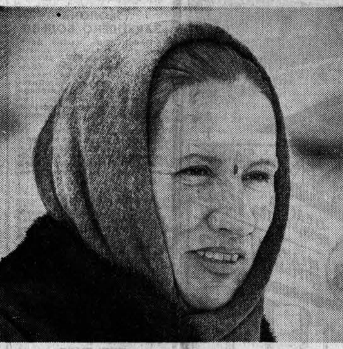
Калманский район.