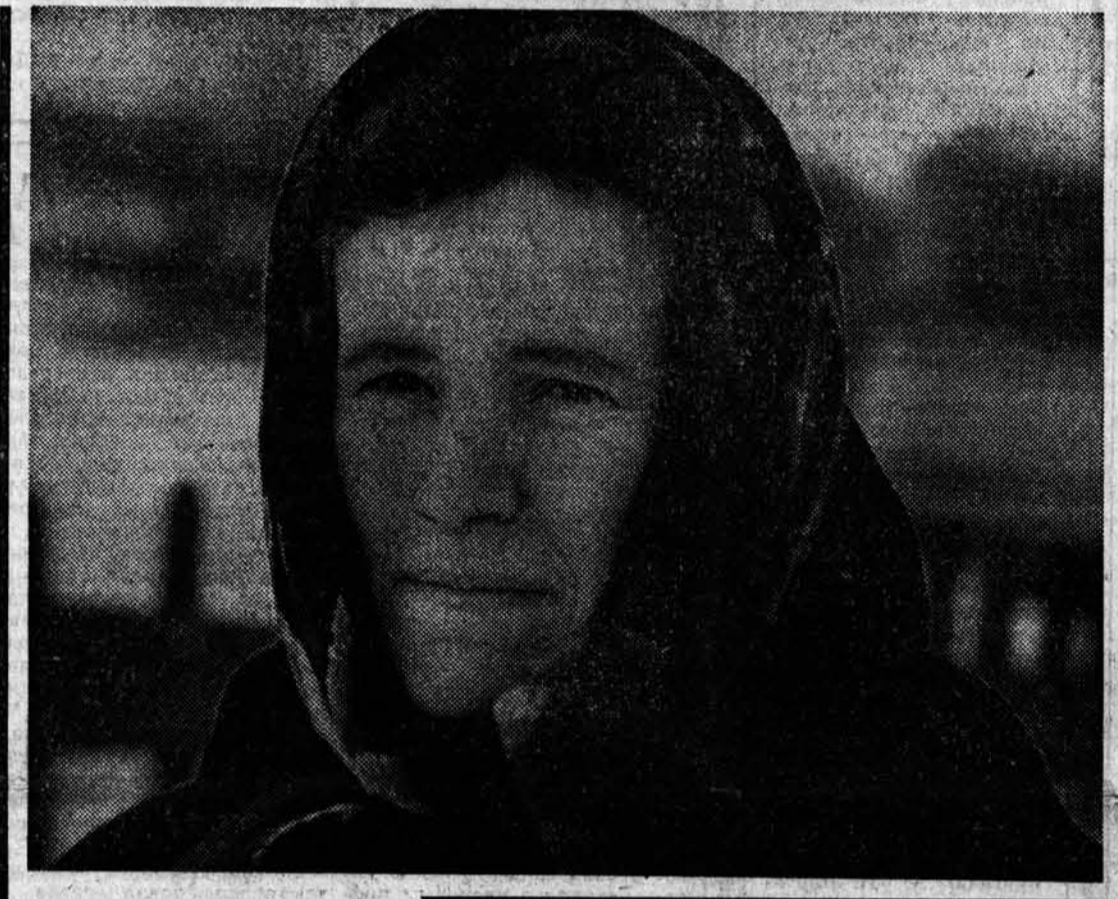
Фото В. Выборова. Первомайский район.

С заседания краевого штаба Коксохима В г. Заринске на прошлой неделе состоялось заседание краевого штаба по строительству Алтайского коксохимического завода. На нем рассмотрены итоги работы за октябрь и десять месяцев, ход строительства, монтажа и наладки на объектах пускового комплекса — первой коксовой батарее. Отмечено, что за последние время введен в эксплуатацию ряд важных объектов, в том числе станция обезжелезивания воды. За октябрь сдано 4.200 квадратных метров жилья, а с начала года — 80 тысяч (при годовом плане 60 тысяч метров). Готовятся к вводу широкоформатный кинотеатр на 600 мест, столовая на 320 мест. До конца года Заринск получит еще 20 тысяч квадратных метров жилья. Вместе с тем крайовой штаб обратил внимание хозяйственников и партийных руководителей, всех строителей и ответственных на тот факт, что объем выполненных строительных-монтажных работ оказался меньше, чем в сентябре. Задержан ввод некоторых сооружений графика строительства и монтажа. Некоторые подразделения не справились с заданиями на октябрь. Так