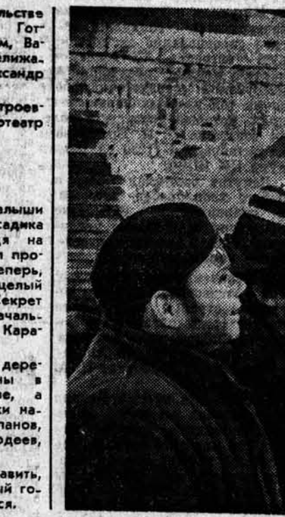
Сейчас барнаульские строители готовят к сдаче кинотеатр «Космос».

Недавно малыши Коксохимы справили еще одно новоселье — им подарили детский сад во втором микрорайоне Заринска строители треста Барнаулжилстрой. Ключи от нового детского учреждения вручили от имени лучших бригад, которые