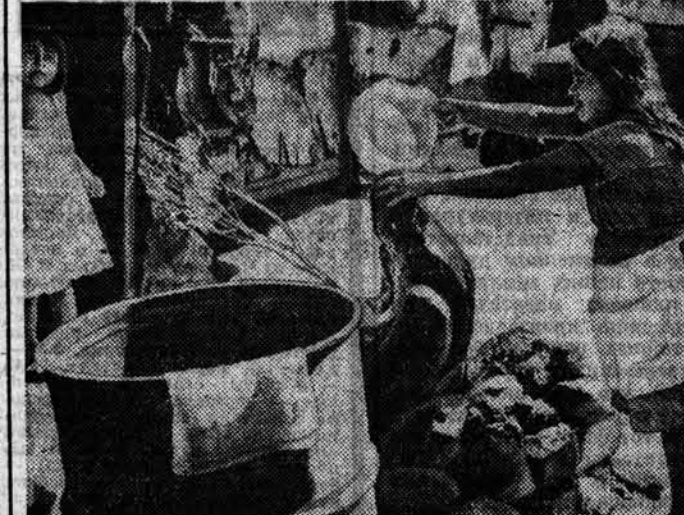
▲ Сальвадор — одно из самых молодых государств Центральной Америки. Почти полвека им правит, сменив один другого, диктаторы, которые довели страну до кризисного состояния, обрекая народ на бедность и нищету. Каждый четвертый сальвадорец умирает от авитаминоза. Более половины населения неграмотно. Правая сторона фотографии — школа, левая — настоящее войну против сальвадорцев — противников режима. НА СНИМКАХ: (вверху) в таких условиях живут общины трущобных детей — самая обеспокоенная категория населения страны (на снимке внизу).

Л. И. Брежнев последовательно выступает за дальнейшее развитие торговых отношений между Востоком и Западом. В настоящее время достигнут огромный прогресс в этом направлении, сказал вице-президент Национального общества жидкого топлива (ЭНИ — Италия) Джузеппе Ратти. Он подчеркнул, что торговля — один из важнейших факторов укрепления мира. Политика сдерживания гонимых вооружений, разрядки, поборником которой является Л. И. Брежнев, способствует расширению и торговым отношениям между странами, в частности между Италией и СССР. Это помогает Италии решать энергетическую проблему, одну из главных проблем современности. Л. И. Брежнев, пишет болгарская газета «Работническо дело», подчеркивал особенно