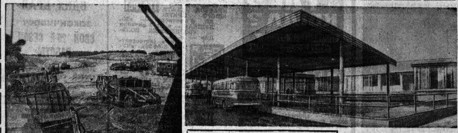
По городам края

ЛИМА. (ТАСС). Перуанская компартия призвала своих членов, все прогрессивные демократические силы страны сплотиться ради усиления борьбы за единство, за защиту интересов трудящихся и народных масс.