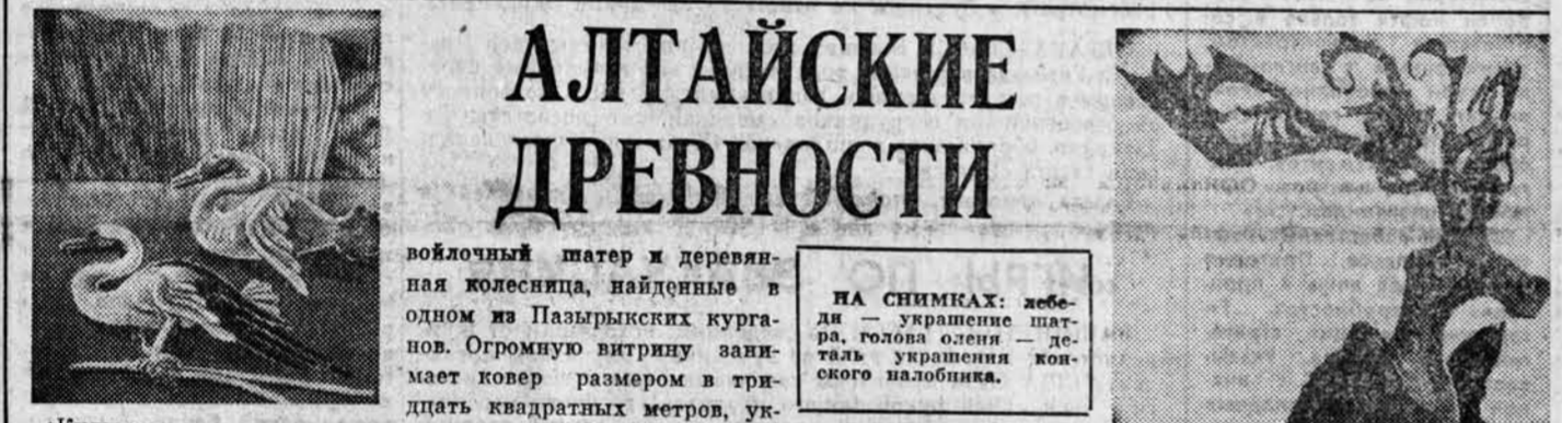
Лодочный шатер и деревянная колесница, найденные в одном из Пазырыкских курганов. Огромную витрину занимает ковер размером в тридцать квадратных метров, украшенный стенами шатра. По белому полю войлока в технике аппликации исполнены цветные узоры и повторяющиеся на двух полосах изображения сидящей в кресле богини со священным деревом в руке и ползающего кобра к ней всадника.

ВЕНА. (ТАСС). Такого наплыва народа в просторный помещенец одного из крупнейших австрийских банков «Кредитанштадт», расположенного на центральной улице Вены — Грабене, давно не было. Огромный ливень вызвал необычайный нахальный саус: чемпион мира Анатолий Карпов, находящийся сейчас в австрийской республике по приглашению Шахматной федерации Австрии, дал его известным представителям общественных, политических и культурных кругов страны и пригласившей к нему австрийской журналистке, которую он назвал «машинкой». Вычислительная машина. Именно на 13-й доске, где наш прославленный шахматист мерился силами с электронным мозгом, разгорелась наиболее интересная и захватывающая борьба. Первоначально машина оказывала упорное сопротивление. Однако остроумные и стремительные действия «чемпиона мира» поставили ее в тупик, и ЭВМ стала давать сбои. В конце концов она вынуждена была сдаться. Карпов победил и в партиях на остальных двадцати досках.