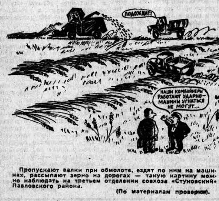
Пропускают валки при обмолоте, ездят по ним на машинах, рассыпают зерно на дорогах — так часто можно наблюдать на третьем отделении совхоза «Ступинский» Павловского района. (По материалам проверки).

Активно действуют на уборке пионерские патрули в совхозе имени Гастелло Хабаровского района, помогающие дозорным хозяйствам в борьбе с потерями. Пионеры Гастелловской средней и Новополюстровской восьмилетней школ установили свои посты на каждом поле совхоза, осматривают все приближающиеся суда машины с зерном. Ничего не ускользнет от острого света «Пионерских фонариков», по сигналам пионерских патрулей принимаются незамедлительные меры. В. КРОПОВ, секретарь парткома совхоза имени Гастелло.