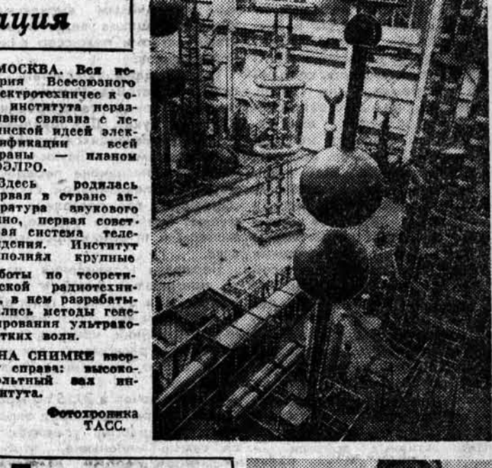
НА СНИМКЕ сверху справа — высоковольтный зал института.

ЯРОСЛАВСКАЯ ОБЛАСТЬ. В недавнем постановлении ЦК КПСС «Об инициативе Ярославской областной партийной организации по достижению в одиннадцатилетний период производства без увеличения численности работающих» подчеркивается важность народнохозяйственного значения повышения производительности труда. Они поставили перед собой цель — за 1978—1985 годы в 2,8 раза увеличить объем выпускаемой продукции на старом моторе в четыре раза.