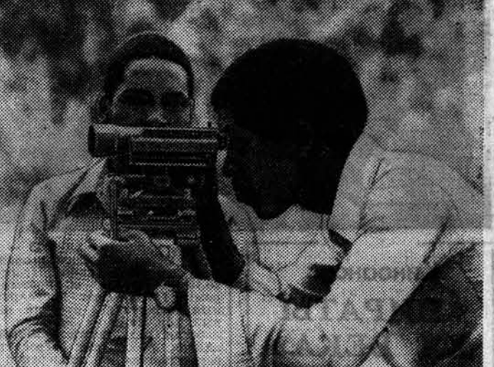
В ОБЪЕКТИВЕ — МОЗАМБИК

НАРОДНАЯ РЕСПУБЛИКА МОЗАМБИК строит новую жизнь. Уже более пяти лет трудящиеся страны под руководством партии ФРЕЛИМО проводят широкие социально-экономические преобразования. Земля перешла в руки тех, кто ее обрабатывает, общедоступными стали здравоохранение и образование. Обеспечить всех трудящихся жильем — такова цель долгосрочной программы жилищного строительства. В предместьях крупных городов вырастают города-спутники, тысячи семей уже переехали в благоустроенные квартиры.