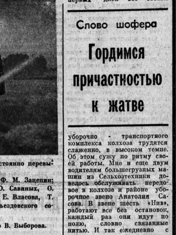
С УТРА ДО ПОЗДНЕГО ВЕЧЕРА НЕ СМОЛКАЕТ ГУЛ КОМБАЙНОВ И ТРАКТОРОВ НА ПОЛЯХ СОВХОЗА «ПОДОНИЦОВСКИЙ», ГДЕ В СОСТАВЕ КОМПЛЕКСОВ ЖАТВУ ВЕДУТ ШЕСТНАДЦАТЬ БЕЗНАРЯДНЫХ ЗВЕНЬЕВ.