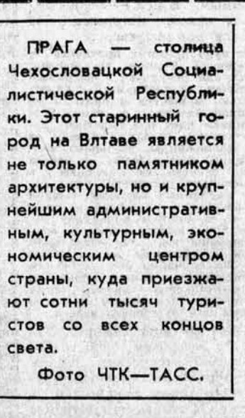
Прага — столица Чехословацкой Социалистической Республики