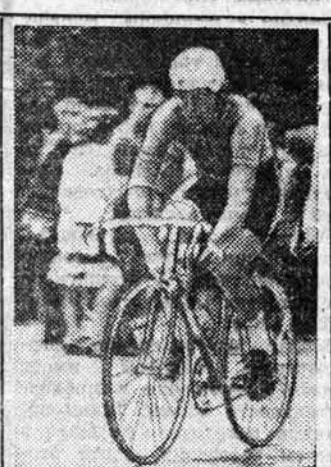
В индивидуальной гонимой гонке на 189 км чемпионом стал советский спортсмен Сергей Сухорученков, которого вы видите на снимке.

В НАРУШЕНИЕ ТРАДИЦИИ свой рассказ я пишу с рекордом, которое между тем стало, пожалуй, самым ярким мгновением в легкоатлетическом соревновании в Лужниках 28 июля.