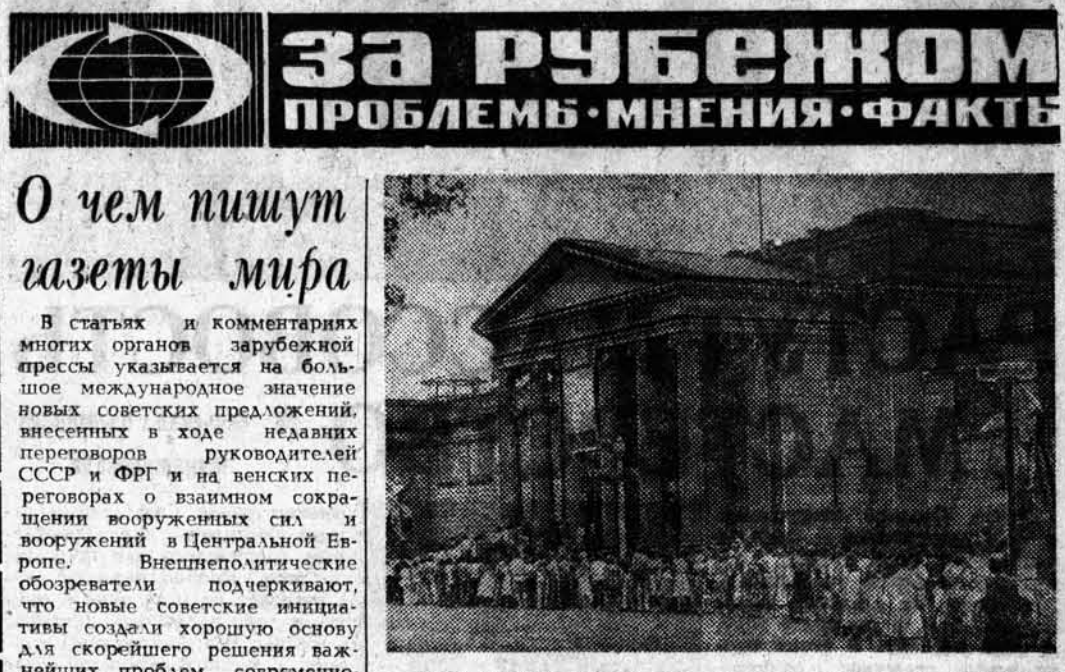
АВСТРАЛИЯ. С большим успехом в Сиднее проходила выставка картин из коллекций Эрмитажа, Третьяковской галереи и Пушкинского музея (на снимке).

Трактористам - машинистам, занятым на вспашке почвы под посев озимых культур, на посеве озимых и вспашке ранней зяби, продавать до 7 килограммов зерна (по закупочной цене) за каждую сменную