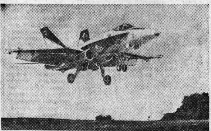
Соединенные Штаты продолжают наращивать свои военные арсеналы. Общий объем заказов Пентагона достиг 63,3 млрд. долларов. Они были направлены в значительной степени на разработку и создание качественно новых систем оружия массового уничтожения.

ваны страны АКТ, а отдельные проекты, обещающие привлекать монополиям. Английский журнал «Экспресс» подчеркивает, что главное для ЕЭС — создать в странах АКТ наиболее благоприятные условия для развития капиталовложений и тем самым содействовать развитию частного сектора в их экономике. Статистика свидетельствует: если за 1969—1975 годы приток частного капитала изза границы в страны АКТ составил 6,3 миллиарда долларов, то в качестве прибыли было вывезено 12 миллиардов. 13 крупных английских компаний «заработали» в Африке в одном только 1977 году 280 миллионов фунтов sterling. Это больше, чем вся помощь Англии африканским странам в том же году. Тем не менее, с торжеством заявил бывший генеральный секретарь АКТ Т. Конате, в штабквартире «Общего рынка» в Брюсселе не стесняются говорить о «партнерстве равных». Даже, казалось бы, хорошие начинания, предпринимаемые в рамках Ломской конвенции, не дают оптимистичной картины развивающимся странам. Это можно проследить на примере созданного в рамках АКТ—ЕЭС фонда стабилизации экспортных доходов стран АКТ — «Стабтекс». По идее фонд призван компенсировать развивающимся странам валютные потери от снижения мировых цен на их товары. В соответствии со Второй Ломской конвенцией список товаров, включенных в «Стабтекс», значительно расширился. В дополнение к нему образован фонд «Минтекс», который должен стабилизировать цены на минеральное сырье. Однако средства из фондов предоставля-