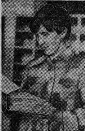
В честь юбилея родного города барнаульские связисты провели конкурсы профессионального мастерства среди почтовых, телеграфистов и сортировщиков письменной корреспонденции, в которых приняли участие работники этих ведущих профессий от главных и прижелезнодорожного и городского отделений связи.

Горисполком обратился с просьбой к редакциям газет, радио, телевидения систематически информировать трудящихся о ходе соревнования за город высокой культуры, раскрывать опыт работы лучших коллективов по озеленению и благоустройству микрорайонов, решительнее вскрывать факты небрежного отношения к зеленым насаждениям, их порчи и гибели.