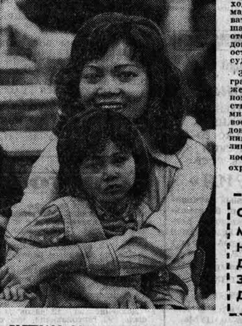
ВЬЕТНАМ. Материнство.

САН-ФРАНЦИСКО (ТАСС). Префранцы продолжают две недели поисково-спасательные операции в районе вулкана Сент-Хеленс, мощное извержение которого произошло 18 мая. Удалось обнаружить тела 35 погибших, еще 42 человека числятся пропавшими без вести. Однако представители поисково-спасательной службы потеряли каку-либо надежду найти их.