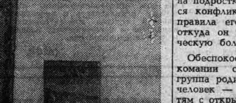
НА СНИМКЕ: Луис Корвалан беседует с обучающимися в школе-интернате детьми чилийцев.