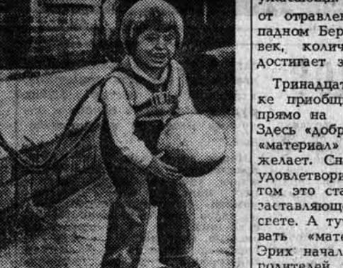
СЕГОДНЯ — МЕЖДУНАРОДНЫЙ ДЕНЬ ЗАЩИТЫ ДЕТЕЙ