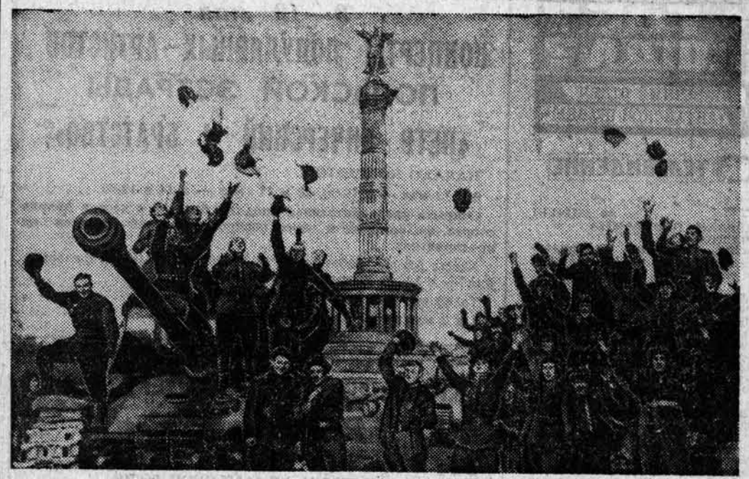
35 лет назад, 30 апреля, над рейдотом советские воины вооружили Знамя Победы. Снимок «Победа» (Советские танкисты в Берлине, 1945 год).