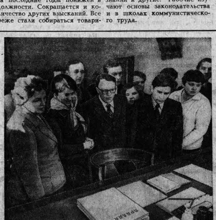
ПРОШЛИ МОСКОВСКОМ СТАНКОСТРОИТЕЛЬНОМ ЗАВОДЕ «КРАСНЫЙ ПРОЛЕТАРИЙ» практически все рабочие и инженерно-технические работники.