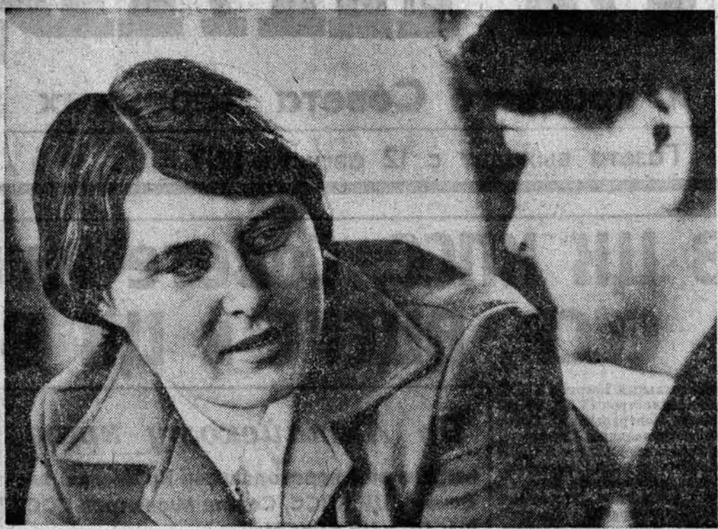
ЛАУРЕАТ ЗАВОДСКОЙ ПРЕМИИ