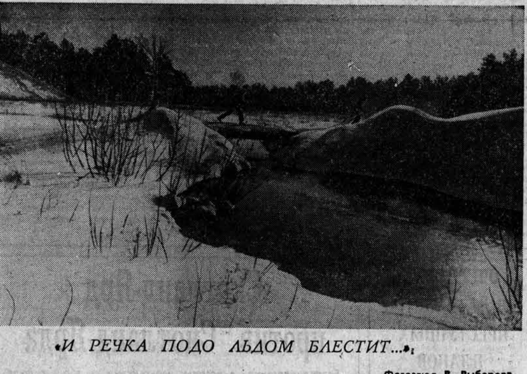
«И РЕЧКА ПОДО ЛЬДОМ БЛЕСТИТ...»

По страницам местных газет ПО ПРОГРЕССИВНОЙ ТЕХНОЛОГИИ В Воскресенском отделении совхоза «Курский» вступила в строй откормочная площадка на 600 голов. Весь скот размещен в трех секциях. В одной из них производится доращивание молодняка, в другой — предварительный откорм, в третьей — заключительный. Затем скот весом более четырех центнеров и в возрасте 18—20 месяцев будет отправляться на мясокомбинат. Весь корм для площадки поступает через корнючок. Мобильная раздача кормов и механизированное навозоудаление значительно облегчили труд мастеров откорма. «СОВЕТСКАЯ КУЛУНДА» , Кулундинский район.