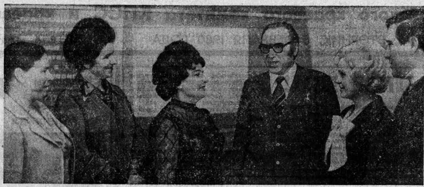
Около пятисот делегатов от 1 миллиона 257 тысяч членов профсоюзов Алтай собрались в этот день во Дворце кочевников на межсоюзную конференцию.

С позиций высокой требовательности делегаты конференции оценили деятельность профсоюзов края и определили задачи по выполнению решений XXV съезда КПСС, ноябрьского (1979 г.) Пленума ЦК партии, XVI съезда профсоюзов страны.