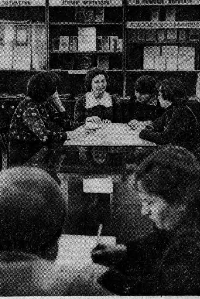
В трех агитпунктах своего микрорайона работают культпросветники барнаульского завода РТИ. — не понадобилось знакомство с участниками, так как они закрепились за теми, где уже второй год ведут массово-политическую работу.