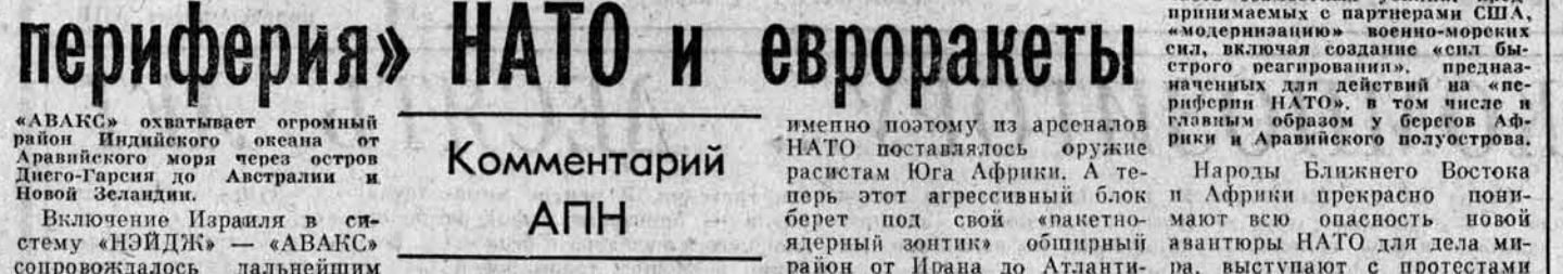
«Африкано-ближневосточная периферия» НАТО и евроракеты

Комментарий АПН «АВАКС» охватывает огромный район Индийского океана от Аравийского моря через остров Диего-Гарсия до Австралии и Новой Зеландии.