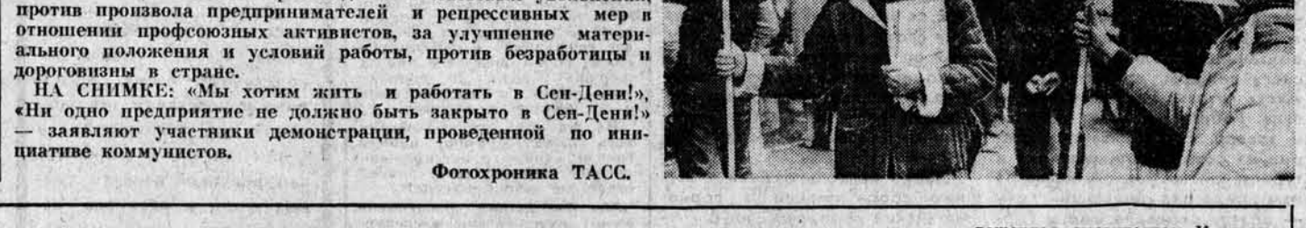
Коммунисты Франции стоят на защите интересов трудящихся масс и активно поддерживают их борьбу против свертывания национального производства и массовых увольнений, против произвола предпринимателей и репрессивных мер в отношении профсоюзных активистов, за улучшение материального положения и условий работы, против безработицы и дороговизны в стране.