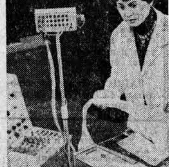
В НИИ животноводства и ветеринарии совместно с учеными ВАСХНИЛ разработана автоматизированная система «СЕНТИКС», которая успешно применяется на всех молочных комплексах республики.