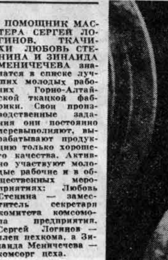
Г. Горно-Алтайск.