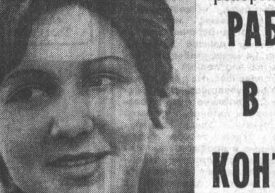
ФОТО-РЕПОРТАЖ РАБОТАЕТ В ЦЕХЕ КОНТРОЛЕР

ТРЕТИЙ МЕХАНИЧЕСКИЙ ЦЕХ — одно из основных подразделений аппаратурно-механического завода.