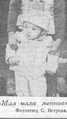
«Мал мала меньше».

В. ПАШИН, корр. ТАСС. Краснона-Волге, Костромская область.