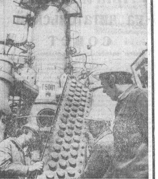
ЕДР. Огнеупорный комплекс в Белеусе, вырабатывающий ценные неметаллические продукты из советского сырья, был построен в рамках соглашения о кооперации и специализации производств при содействии пяти заинтересованных стран. В этом году специалисты из Чехословакии, Венгрии и ГДР (на снимке) союдами осуществляют работы по реконструкции и модернизации оборудования предприятия.

Заметки политического обозревателя УГРОЗА ЕВРОПЕ