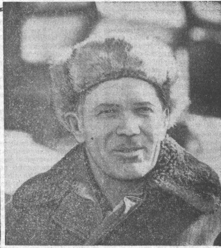
Успешно ведут ремонт сельскохозмашиностроительной техники механизаторы совхоза «Центральный». Двухдневный ремонт комбайна уже поставлен на зимнее хранение. Ремонт остальных 27 агрегатов земельной техники завершится до первого марта следующего года.

Медленно ведут отгрузку хлеба государству хозяйства Топчихинского, Усть-Калманского, Краснощенинского, Родинского, Романовского и Хабарского районов.