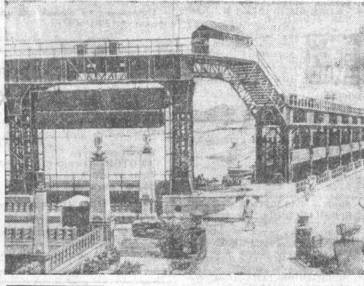
ИНДИЯ. Мощная гидроэлектростанция Бхакра-Нангал построена при техническом и экономическом содействии Советского Союза. Общая длина ирригационных каналов ГЭС превышает 4,5 тысячи километров. Орошаемая ими площадь — около полутора миллионов гектаров. НА СНИМКЕ: плотина ГЭС Бхакра-Нангал.

Гернх БОРОВИК, спец. корр. АПН, Манагуа.