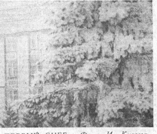
«ПЕРВЫЙ СНЕГ».