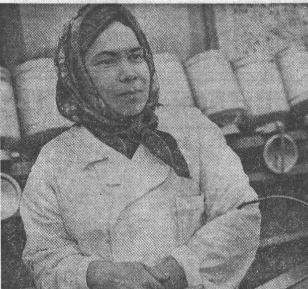
Горно-Алтайская обл.