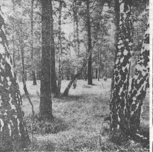
УТРО В ЛЕСУ.