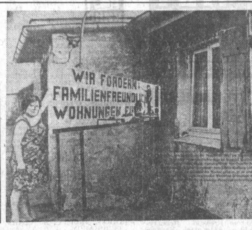
Около 25 тысяч граждан ФРГ ежегодно теряют кров над головой из-за роста безработицы и провала домовладельцев, постоянно завышающих квартплату, которая становится недостижимой для простых тружеников.