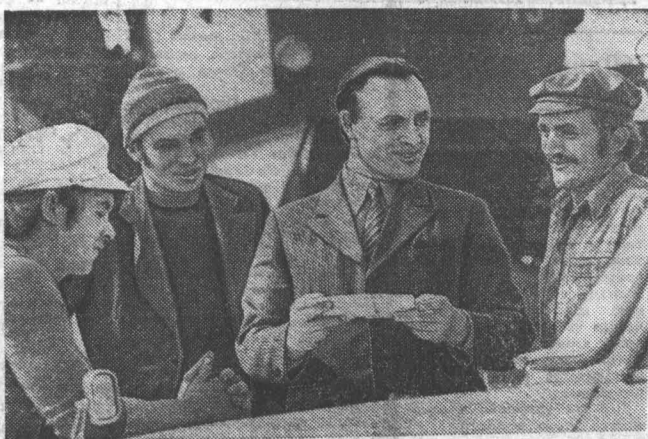
Фото-репортаж С МОЛОДЫМ ЗАДОРМ

Ня днем ни ночью не утихает шум страды на полях совхоза «Советский» Косихинского района. Хлеборобы уже убрали свыше половины площади зернового клена. Рядом с опытными мастерами отлично трудятся молодые комбайнеры.