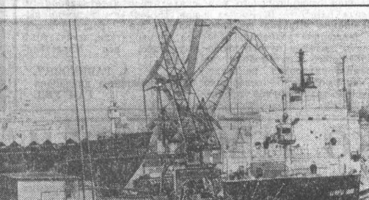
Справа на фотографии вы видите «Адмирала Ушакова» — седьмой контейнеровоз, построенный в текущем году.

Искусство народного пения и игры на народных инструментах не входит в учебные программы консерватории, но в Болгарии есть кому хранить, популяризировать и развивать богатые традиции народной музыки.