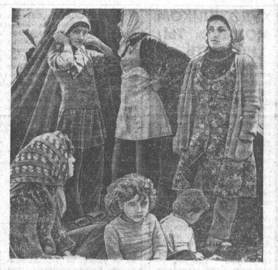
НА ЮГЕ ЛИБАНА продолжает литься кровь. Не проходит почти ни одного дня, чтобы израильская авиация не бомбила жизненно важные объекты на территории этого государства...