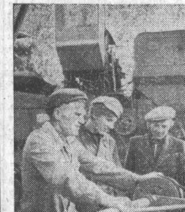
Ничье на уборке коммунисты — механизаторы колхоза «Октябрь» Кытмановского района — объединились в единую партийную группу уборочно-транспортного комплекса. Они, возглавив социалистическое соревнование, показывают пример в труде на всех участках страды — на жатве и обмолоте, на току и вспашке зяби. Особое внимание партгруппа уделяет шефству-наставничеству, помогает молодежи овладеть хлеборобским мастерством.

Учет оперативной обстановки, постоянный контроль за каждым полем позволяют нам вести уборку урожая в четком ритме, наращивая темпы. Из 71 тысячи гектаров уборочной площади хлеба скошены на 41 тысяче и на 27 тысячах подработаны валки. Государству сдано более 12 тысяч тонн зерна.