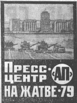
Пресс-центр НА ЖАТВЕ-79

Труженики района делают все возможное, чтобы перекрыть отставание прошлого года по продаже зерна государству, обеспечить засыпку высококачественных семян, подготовить зяби, заложить прочный фундамент для получения высоких урожаев в 1980 году и своевременно подготовиться к зимовке скота.