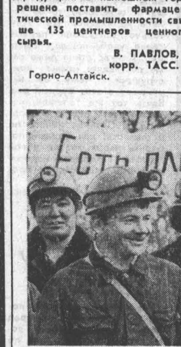
Есть план 4-х лет!