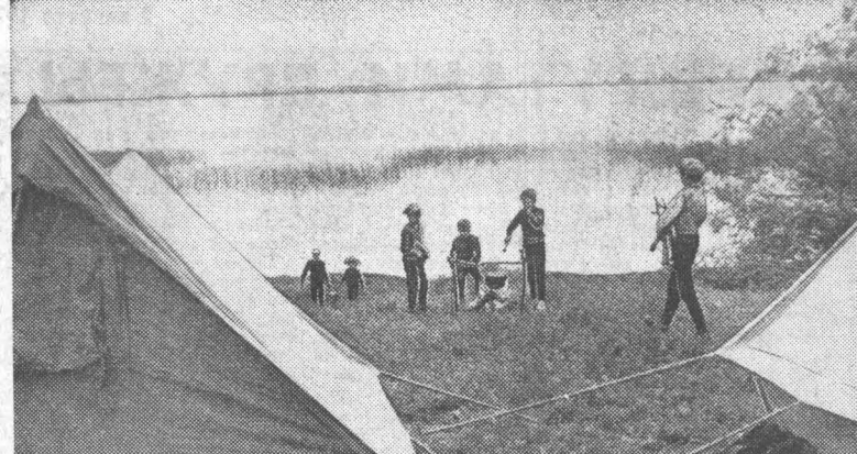
«УТРО ТУРИСТОВ».