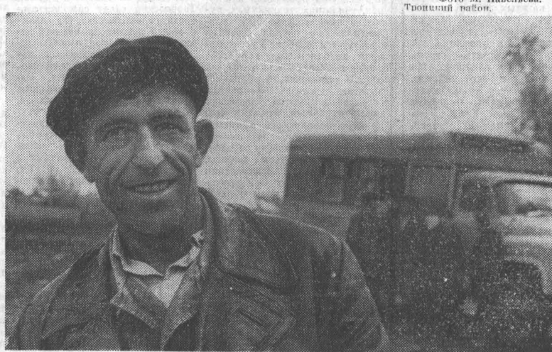
И. ИВАНОВ. Благоуещенский район.

ПО ПОЛТОРЫ НОРМЫ Во всех бригадах колхоза имени XXI партсъезда Благоуещенского района ведутся полевые работы. Последние дни апреля порадовали земледельцев обильными осадками. Каждый гектар пшвы получил хорошую влагозарядку.