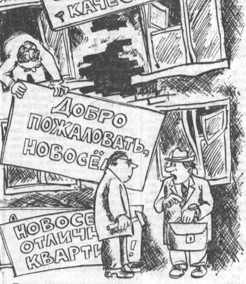
Поторопитесь прикрыть дыры — через час дом сдаем.