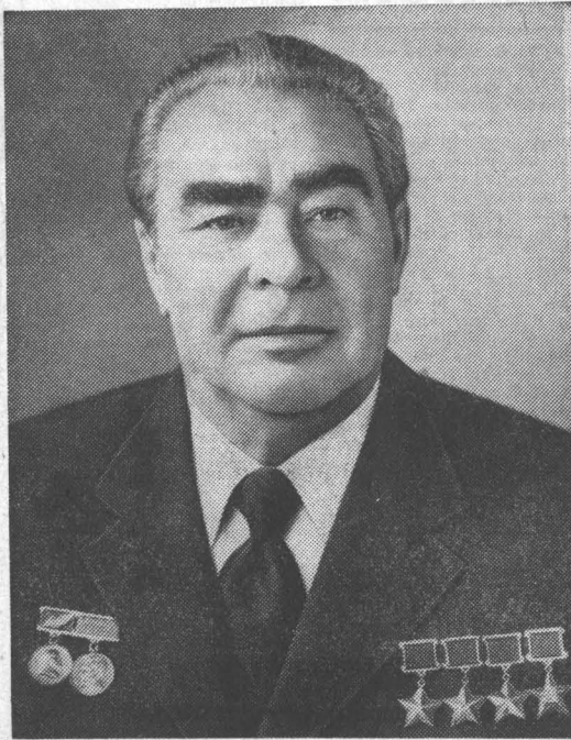
Л. И. БРЕЖНЕВ, Председатель Президиума Верховного Совета СССР.