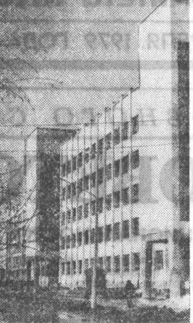
НОВЫЙ ДОМ. (ПРОСПЕКТ КОМСОМОЛЬСКИЙ).