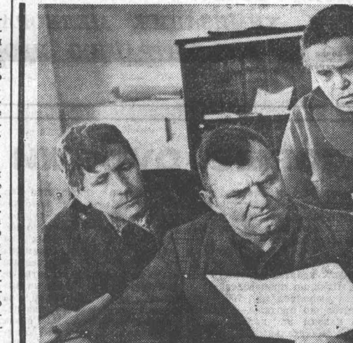
В. МИЩЕНКО, второй секретарь крайкома КПСС.

Хочу добавить, что новшества коснулись и заочного факультета. Он полностью переводится в Бийск. Существующий там филиал АПИ располагает благоприятными условиями для поступления в учебно-заочники. В связи с этим заметно расширен ве-