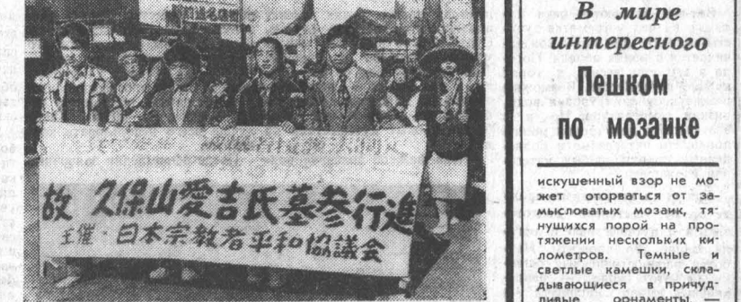
ЯПОНИЯ. Атолл Бикини в Тихом океане, который в 50-х годах использовался Пентагоном в качестве полигона для испытаний ядерного оружия, будет представлять опасность для здоровья людей еще в меньшей мере 100 лет. К такому выводу пришла специальная комиссия министерства энергетики США, исследовавшая уровень радиации на атолле.

КАБУЛ. (ТАСС). Правительство ДРА принимает решительные меры по пресечению преступной деятельности врагов афганского народа, покушающихся на суверенитет и независимость республики. По имеющимся сведениям, в последние дни 17-я советская дивизия продолжает операцию по ликвидации контрреволюционных банд. Практически вся территория провинции Бадкхиз охвачена отрядами Внутренней безопасности и подразделениями вооруженных сил. В провинциях Кунар и Пандж, прилегающих к пакистанской границе, продолжаются перестрелки и столкновения военных подразделений с отдельными бандитскими группами, основные базы которых находятся на территории Пакистана. Согласно полученным данным, эти банды получают из-за рубежа вооружение и боеприпасы, а также продовольствие. Обстановка в других провинциях страны остается спокойной.