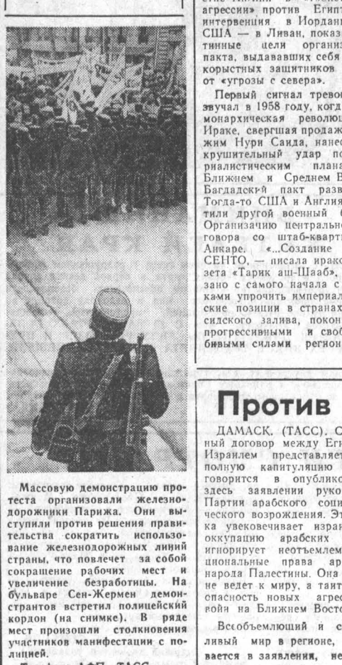
Массовую демонстрацию protesta организовали железнодорожники Парижа.

Вот, поощряемые и вооруженные из Китая, пытаются затруднить консолидацию народной власти, создание предпосылок для мирной жизни в этой стране.