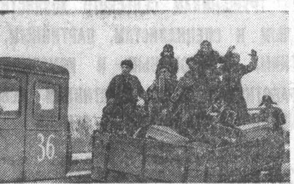
ВЕСНОЙ 1954 года почти ежедневно шла аэрация целинных земель на Алтай. Эти новоселы направлялись в совхоз «Чистовский» Тогучинского района.

Этот снимок сделан в 1972 году во время посещения полей Алтайского научно-исследовательского института земледелия и селекции сельскохозяйственных культур. Л. И. Брежнев подробно интересовался вопросами селекционной работы. Он пожелал ученым быстрее создать и дать земледельцам Сибири высокоурожайный сорт яровой пшеницы, обладающей хорошими мукомольными и хлебопекарными качествами, а также разработать агротехнику его возделывания.