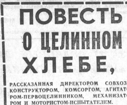
РАСКАЗАННАЯ ДИРЕКТОРОМ СОВХОЗА, КОНСТРУКТОРОМ, КОМСОРГОМ, АГИТАТОРОМ-ПЕРВОЦЕЛИННИКОМ, МЕХАНИЗАТОРОМ И МОТОРИСТОМ-ИСПЫТАТЕЛЕМ.