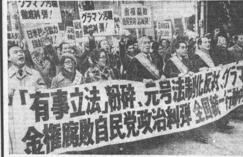
ЯПОНИЯ. «По допустимым возмездиям реакции и милитаризма», «Нет — чрезвычайному авторитаризму!» «Долой авторитарную политику консерваторов!» — под такими лозунгами в токийском парке Мейдзи недавно состоялся массовый митинг трудящихся. Он был организован демократическими организациями страны. В митинге приняли участие свыше 15 тысяч человек, съехавшихся в японскую столицу со всех концов страны.