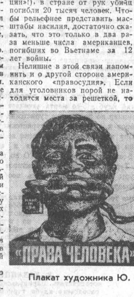
Плакаты художника Ю. Кершина.

дительный показатель «эволюции» в стране от рук убийц погибли 20 тысяч человек. Чего бы больше представить масштабы насилия, достаточно сказать, что это только в два раза меньше числа американцев, погибших во Вьетнаме за 12 лет войны. Нелишне в этой связи напомнить и о другой стороне американского «правосудия». Если для уголовников порой не находится места за решеткой, то в отношении честных американцев, выступающих в защиту своих гражданских прав, американская Фемида проявляет подлинную жестокость. К 282 годам заключения были в общей сложности приговорены члены так называемой «суингтонской десятки», виновные лишь в том, что требовали от правительства справедливости. Д. ГОЛУБЕВ, (ТАСС).