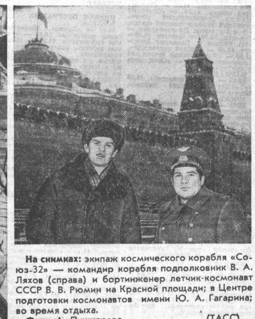
На снимках: экипаж космического корабля «Союз-32» — командир корабля подполковник В. А. Ляхов (справа) и бортинженер летчик-космонавт СССР В. В. Рюмин на Красной площади; в Центре подготовки космонавтов имени Ю. А. Гагарина; во время отдыха.