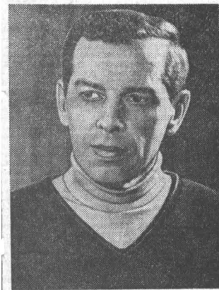
НАРОДНЫЙ АРТИСТ РСФСР Г. ЖИЖЕНОВ

Сегодня в Барнауле спектаклем «День приезда — день отъезда» открываются гастроли Академического театра имени Моссовета.