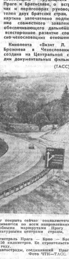
ПРАГА. Густой сетью автодорог покрыта сейчас социалистическая Чехословакия. Они прокладываются по всем направлениям, чтобы связать новыми более удобными маршрутами Прагу с важными индустриальными и культурными центрами страны, с соседними государствами.