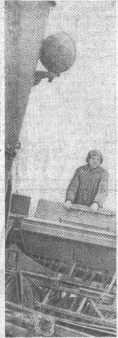
Хорошо подготовились и одними из первых в районе завершили сев земледельцы колхоза «Память Ленина» Павловского района. Семьи зерновых уложены более чем на трех тысячах гектаров. Многие механизаторы на день раньше до полноты сев. Все работы ими проведены в комплексе и качественно, что позволяет вырастить хороший урожай.

При обсуждении вопросов двусторонних отношений было констатировано полное политическое единство и выражено твердое намерение обеих сторон обеспечить дальнейшее повышение уровня и качества советско-чехословацких отношений на всех областях на прочной основе социалистического интернационализма, единства и сплоченности партий, государств и народов обеих стран.