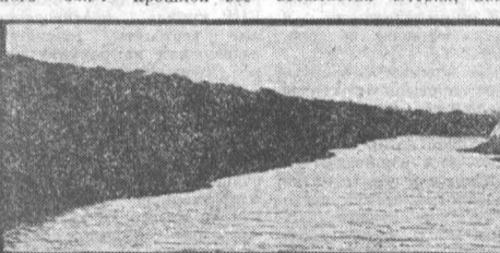
На снимке: лопе этого каляла работа взрывников.

Взрывники, как и саперы, опасаются нельзя. Порою приходится ему работать на крутизне, откуда легко сорваться, на льду, который может провалиться, на автореке, подвешенном к вертолету... И немалое мужество, смеельство часто требуют от него при выполнении задания.