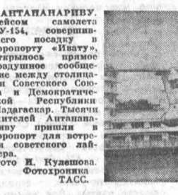
АТАПАНАРБЭВУ. Рейсовый самолет Ту-154, совершившего посадку в аэропорту «Илангу»...