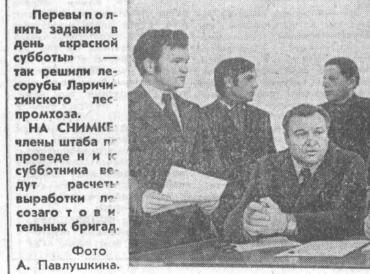
Перевыполнили задания в день «красной субботы» — так решили Ларичинского лесхоза. НА СНИМКЕ члены штаба по проезде и к субботника ведут расчеты выработки лесозаго т о в и тельных бригад.

Материал в помощь лекторам, докладчикам, агитаторам и политинформаторам публикуется на 3-й странице сегодняшнего номера газеты. Барнаульское производственное объединение по выпуску верхней одежды (г. Помыткина) — осуществит в 1978—1980 годах проектирование и строительство 70-квартирного жилого дома и детского сада на 140 мест для Горняцкой пивной фабрики; управление капитального строительства крайисполкома (г. Курланд), Рубцовский строительный трест № 46 (г. Кобзев) — в 1978 году завершит строительство в городе 70-квартирного жилого дома для местных Советов; производственно-техническое управление связи (г. Левков) — организовать в Горняке в 1979—1980 годах трехпрограммное радиовещание. Приняты предложения: управление профтехобразования (г. Душаков) и Локтевского районисполкома — о переводе СПТУ-32 на села Ново-Михайловка Локтевского района в Горняк; объединение Алтайсельстрой (г. Малкин) — организовать в 1978 году ПМК в Локтевском районе для выполнения работ по промышленному, жилищному и культурно-бытовому строительству;