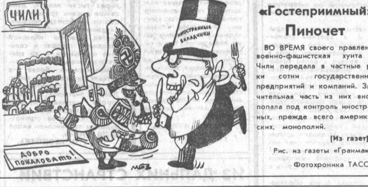
Рис. из газеты «Гранма». Фотохроника ТАСС.

ТИПОГРАФИЯ издательства «Алтайская правда» Алтайского крайкома КПСС. АГ 16513 10.300 Заказ 9500. Тираж 240.000 экз.